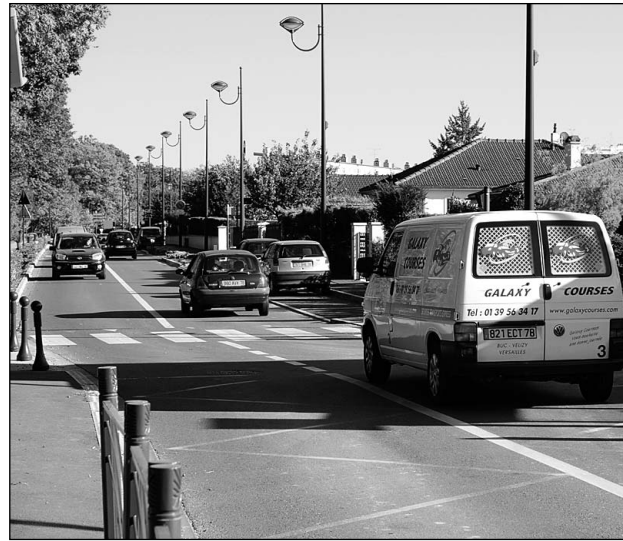
◆ Les habitants de Mermoz craignent que la circulation triple avec la construction d'un immeuble dans le quartier.