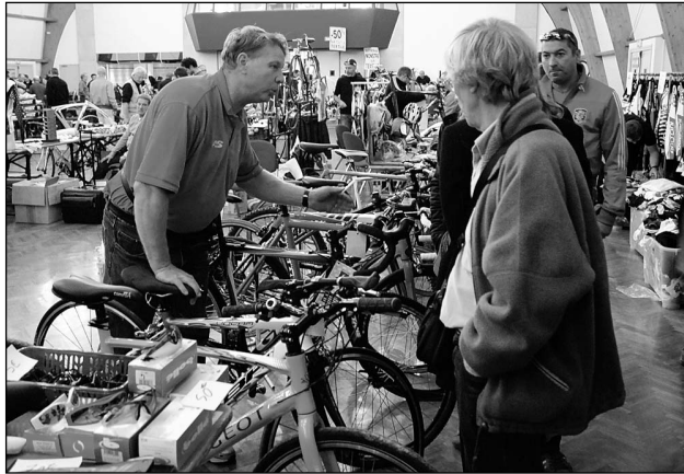
◆ Du dérailleur au guidon, toutes les pièces étaient en vente à la huitième bourse aux vélos.